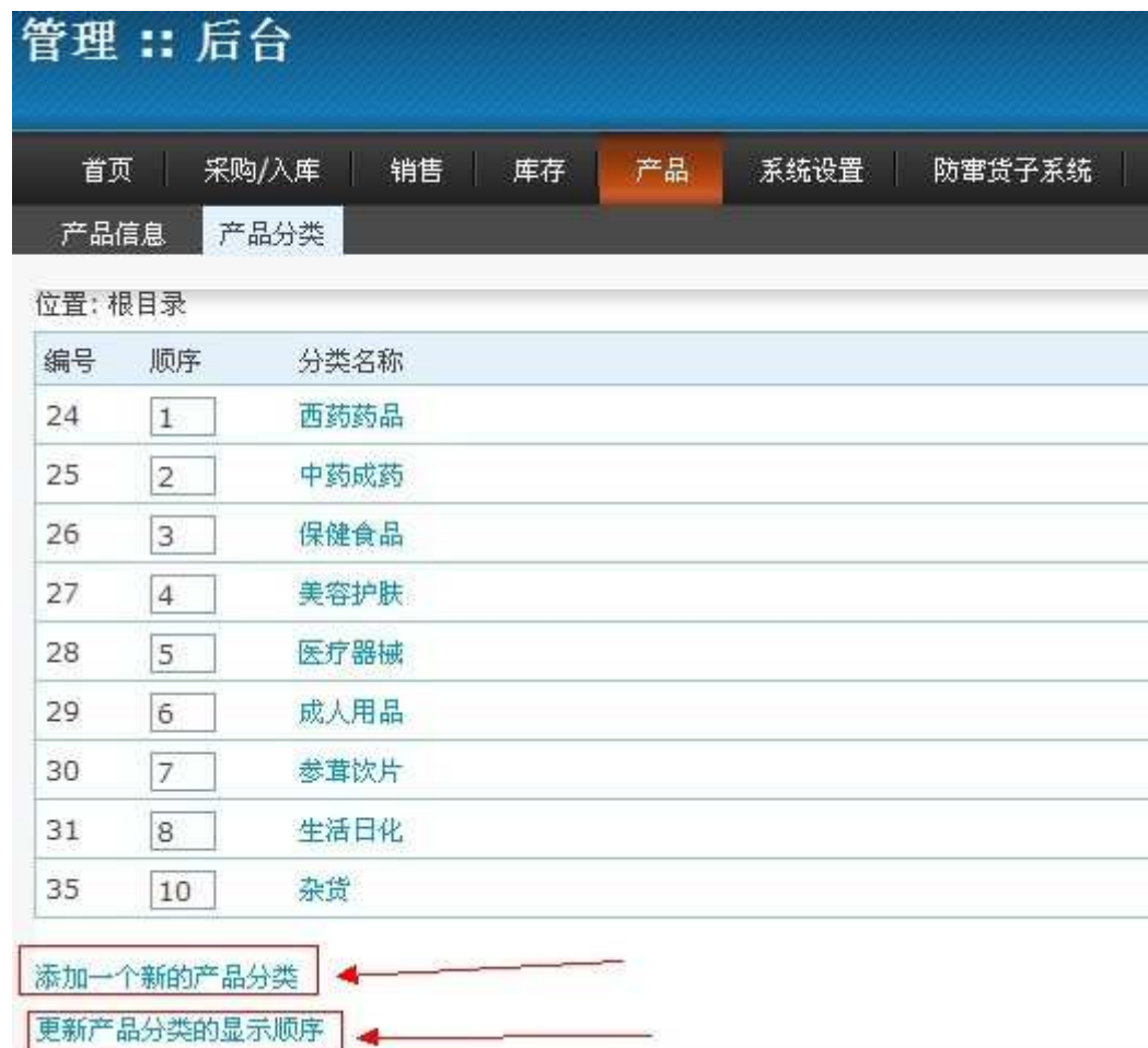
图 2.6. 添加产品分类设置

添加“产品分类”也是在“产品”页面中完成的。进入产品页面在进入“产品分类”便可进行操作。