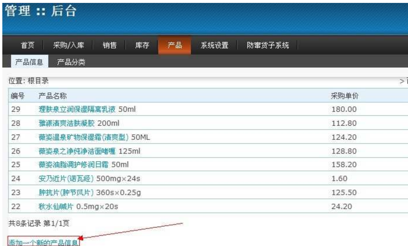
图 2.5. 添加产品信息设置