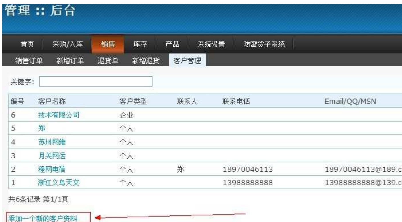
图 2.3. 客户管理设置